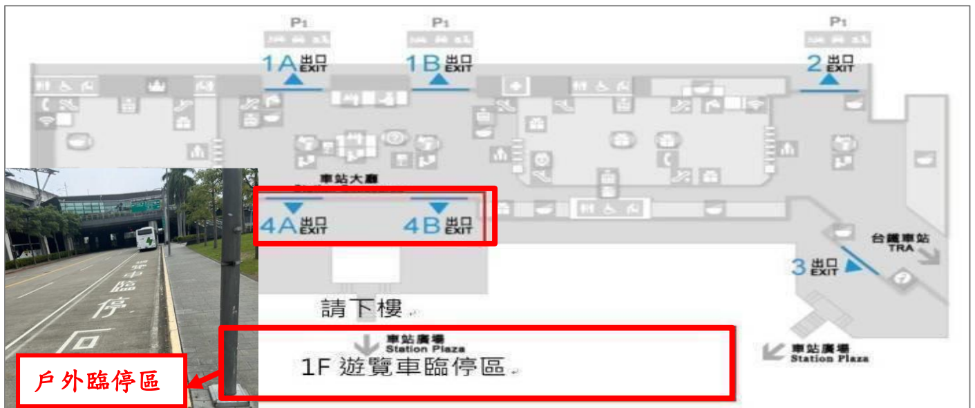
臺中高鐵接駁地點示意圖