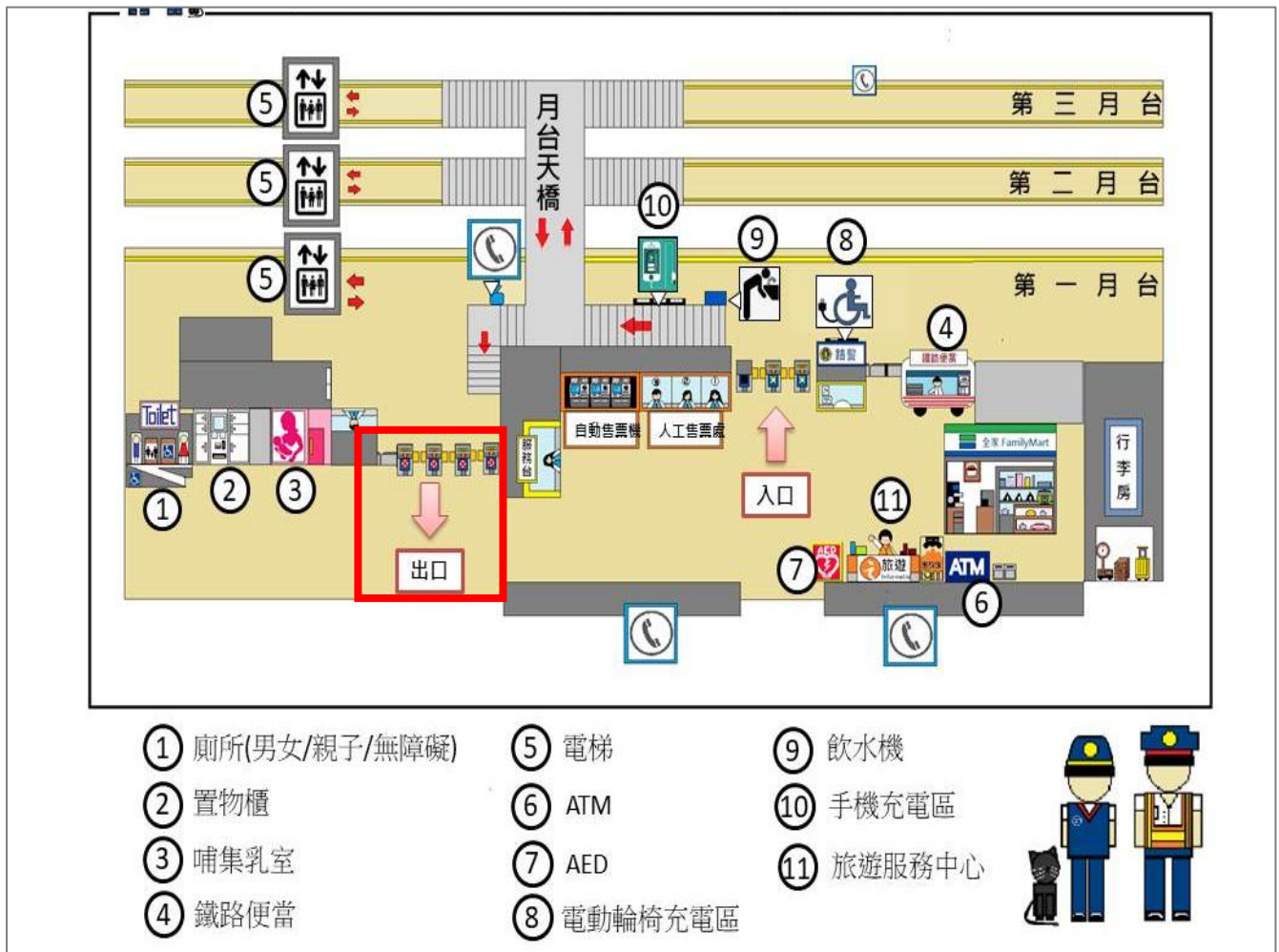
彰化台鐵接駁地點示意圖